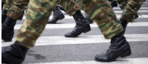
Wie beslist over lot kazerne Tielen? p. 2