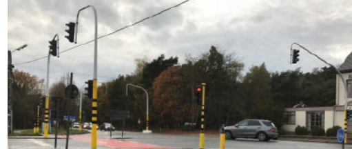
Vreemde verkeerslichten p. 3