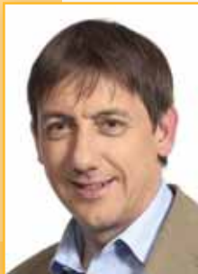
Jan Jambon Vlaams Parlements lid

Jan Jambon: “Analyses, argumenten en cijfers. Dat zijn de sterkste wapens van de N-VA in elk debat. Of het nu gaat over de transfers naar Wallonië, het kostelijke koningshuis of infrastructuurwerken. Populisme en het diaboliseren van tegenstanders laten wij aan anderen over.”