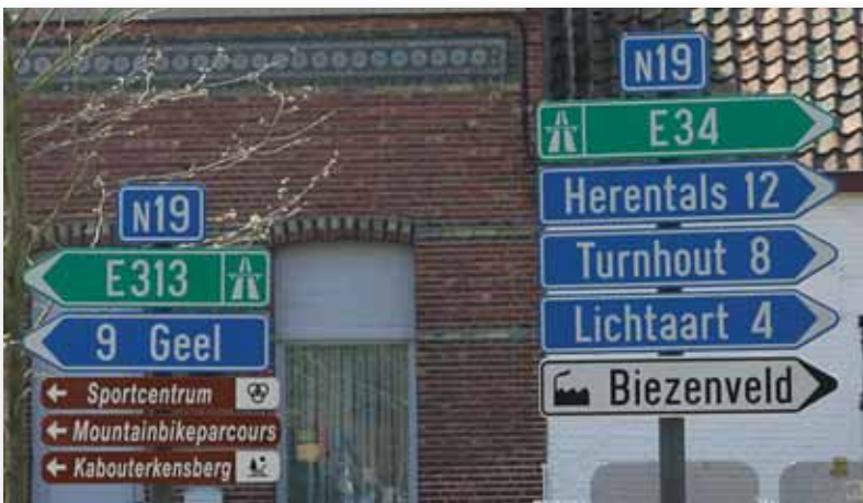
N19 2: Een verbindingsweg tussen twee snelwegen hoort niet thuis in een dorpskom

■ Als inwoner van Kasterlee zal het u waarschijnlijk niet raken waar al dit verkeer vandaan komt en waar het naar toe moet. Voor u telt de verkeersveiligheid, zodat uw kinderen veilig deze weg naar school kunnen kruisen. Voor u telt de woonbaarheid van de dorpskern, zodat u al de dieseldampen niet moet inademen. Voor u telt de rust van de dorpskern, zodat het motorgeluid niet de hemelse gezangen tijdens misvieringen overstemt. En wat is uw mening over al het verkeer dat voorbij raast, terwijl u van een drankje geniet op één van onze talloze terrassen?