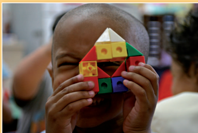
Door het falende migratiebeleid van de traditionele partijen op federaal vlak komt de druk op de steden en gemeenten te liggen.

Ook de asielproblematiek dreigt, door het falende migratiebeleid dat de traditionele partijen op federaal vlak voeren, extra druk te leggen op gemeenten zoals Kasterlee om asielzoekers op te vangen. Mensen in goede verstandhouding laten samenleven is nooit een evidentie, maar een werk van elke dag. Als we dan zien dat enkele politieke partijen in Kasterlee op de gemeenteraad voorstellen om de kerken van Kasterlee, Lichtaart en Tielen open te stellen voor asielzoekers kunnen we maar een zaak vaststellen: het falende asielbeleid is wel degelijk een thema bij deze gemeenteraadsverkiezingen, tot spijt van wie het benijdt!