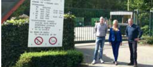
Waarheen met het containerpark? p.2