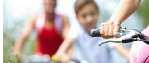
Vlaanderen investeert in Kastels fietsplezier p.3